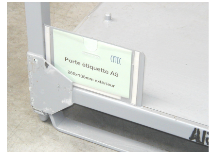
Utilisation sur conteneur métallique